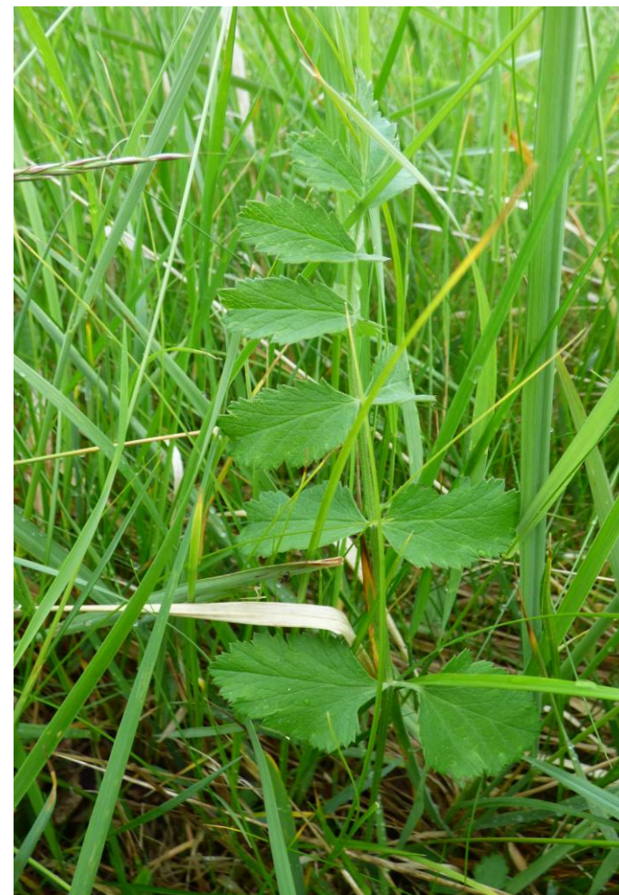
Fot. 6. Biedrzyca mniejszy Pimpinella saxifraga