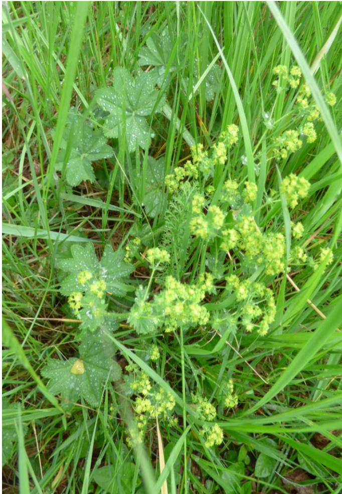
Fot. 1. Przywrotnik Achillea sp.