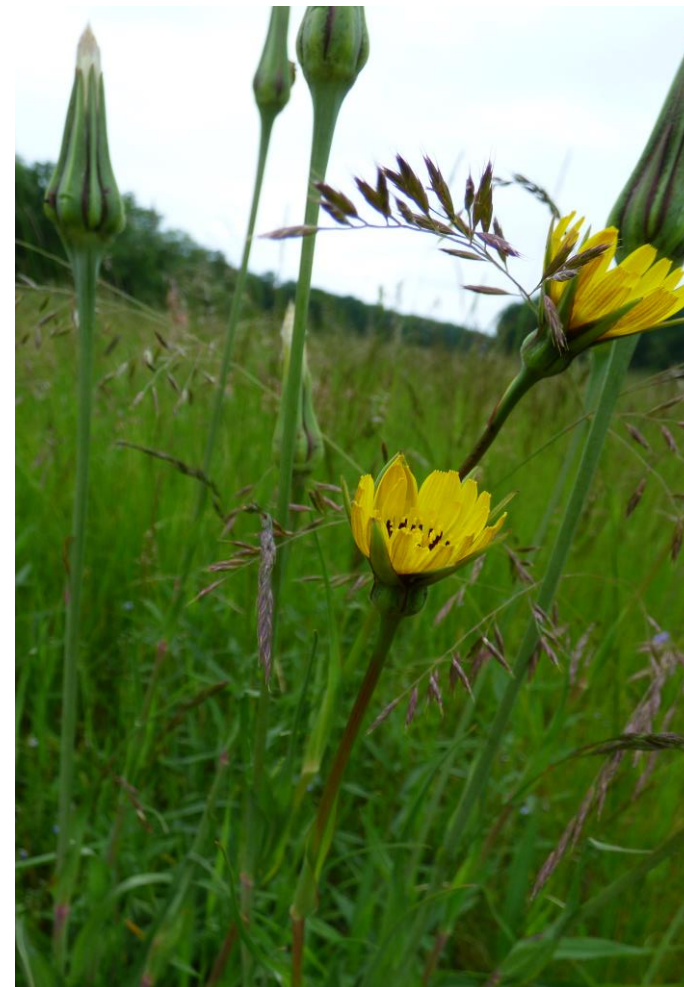
Fot. 10. Kozibród łąkowy Tragopogon pratensis