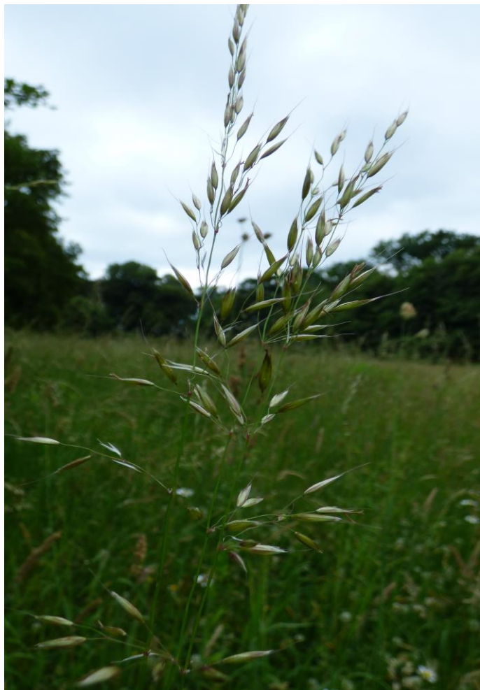
Fot.7. Rajgras wyniosły Arrhenatherum elatius