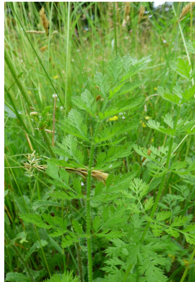
Fot. 8. Marchew zwyczajna Daucus carota