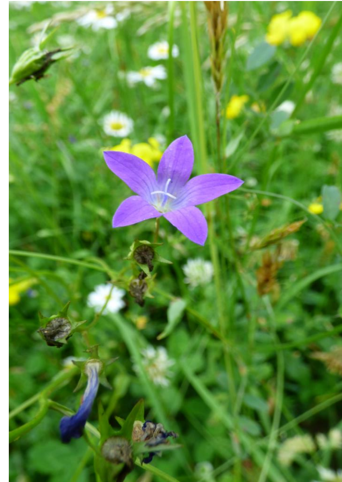
Fot. 2. Dzwonek rozpięchły Campanula patula