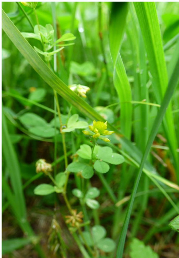
Fot.9. Koniczyna drobnogłówkowa Trifolium dubium