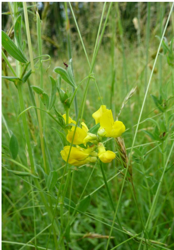
Fot. 5. Groszek łąkowy Lathyrus pratensis